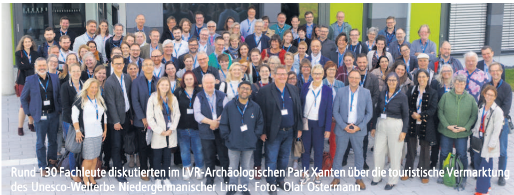
Rund 130 Fachleute diskutierten im LVR-Archäologischen Park Xanten über die touristische Vermarktung des Unesco-Welterbe Niedergermanischer Limes.