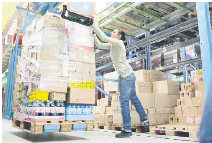
Erkrankungen des Muskel-Skelett-Systems machen den größten Anteil an den Arbeitsunfähigkeits-Tagen aus.

Die Möglichkeiten der Prävention von Muskel-Skelett-Erkrankungen sind vielfältig. Beratung und Schulungen gehören hier genauso dazu wie arbeitsplatzbezogene Maßnahmen. Dabei sollte deren Umsetzung nicht „von oben“ bestimmt werden. Eine Maßnahme wird in aller Regel von den Beschäftigten besser akzeptiert, wenn diese an der Verbesserung beteiligt werden und mitgestalten können. In vielen Fällen liegt eine Problemlösung auch bereits als Idee in den Köpfen der Beschäftigten vor. (akz-o)