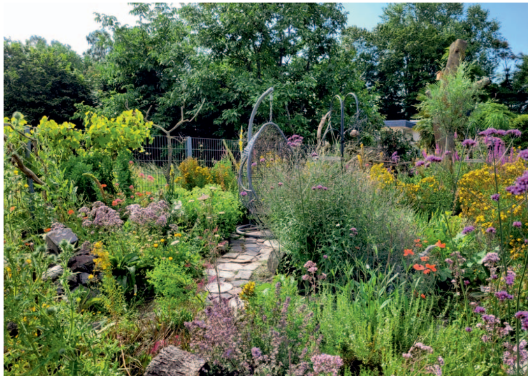
Ehemaliger Gewinnergarten.

Damit der Funke der Begeisterung weitergetragen wird, sollten alle Projektbeteiligten neben ihrer Pflanzaktion auch Infoarbeit vor Ort leisten. Ob Social-Media-Post, Gartenführung oder Pressemitteilung: Die Teilnehmerinnen und Teilnehmer konnten ihrer Kreativität freien Lauf lassen. Sinn und Zweck der Kommunikation ist, das Wissen über naturnahes Gärtnern zu vermehren und damit die biologische Vielfalt weiter zu fördern.