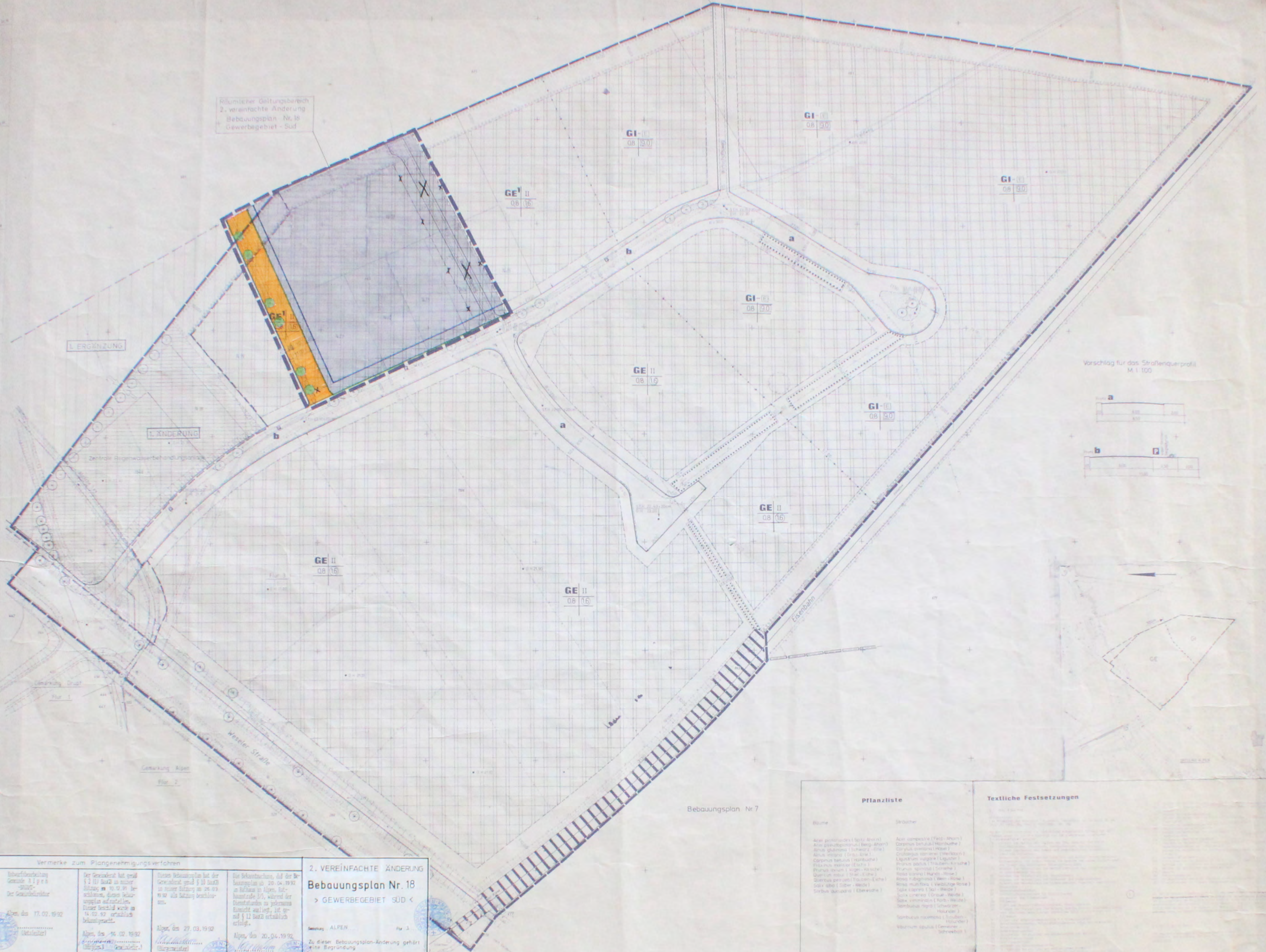
Vorschlag für das Straßenquerprofil M 1:100

Räumlicher Geltungsbereich 2. vereinfachte Änderung Bebauungsplan Nr. 18 Gewerbegebiet - Süd