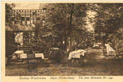
Kurhaus Waldfrieden Alpen (Niederrhein) Tel. Amt Menseln Nr. 144